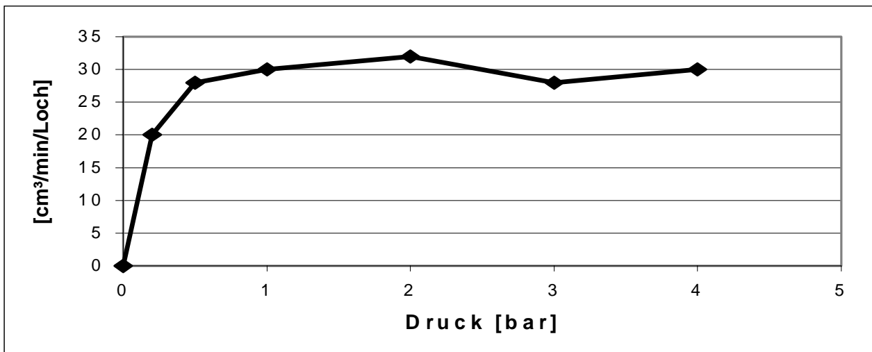
Abb.2: Messprotokoll des eingesetzten DRAUSY-Schlauches

Zur Fixierung des Schlauchsystems im Abwasserkanal wurden verschiedene Möglichkeiten überprüft. Am unempfindlichsten gegenüber Materialanlagerungen erwies sich die freie Verlegung im Kanal. Die Fixierung erfolgte nur im Einlaßschacht. Dadurch wurden Materialanlagerungen und Zopfbildung vermieden.